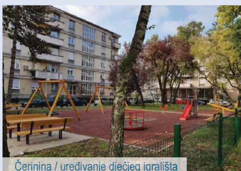
_ Čerinina / uređivanje dječjeg igrališta