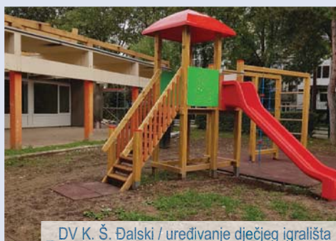
_ DV K. Š. Đalski / uređivanje dječjeg igrališta