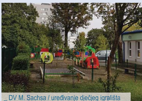
_ DV M. Sachsa / uređivanje dječjeg igrališta