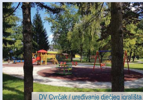
_ DV Cvrčak / uređivanje dječjeg igrališta