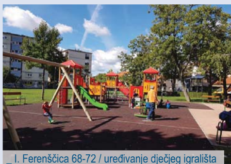
_ I. Ferenščica 68-72 / uređivanje dječjeg igrališta