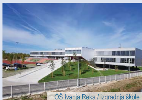
_ OŠ Ivanja Reka / izgradnja škole