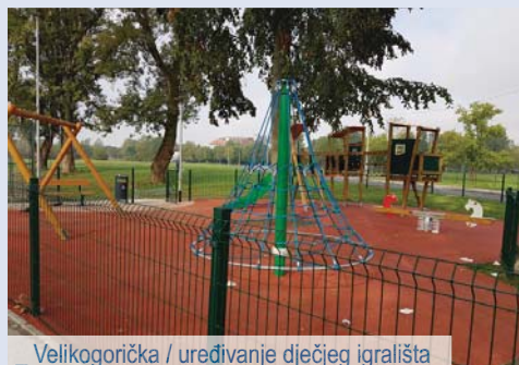
_ Velikogorička / uređivanje dječjeg igrališta